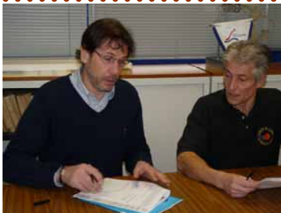
Signature du partenariat entre le CD45 et l'E045

Dimanche 30 MAI ..... MINI TROPHEES à FLEURY les AUBRAIS (mini poussins/mini poussines) ..... dès 9h00