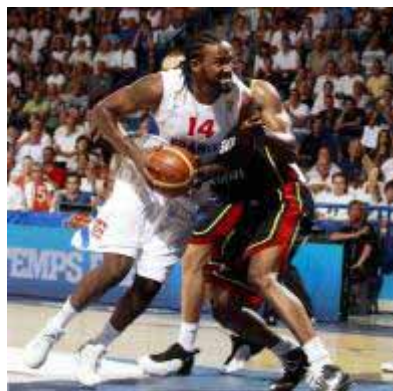
TOUS avec l'Equipe de FRANCE